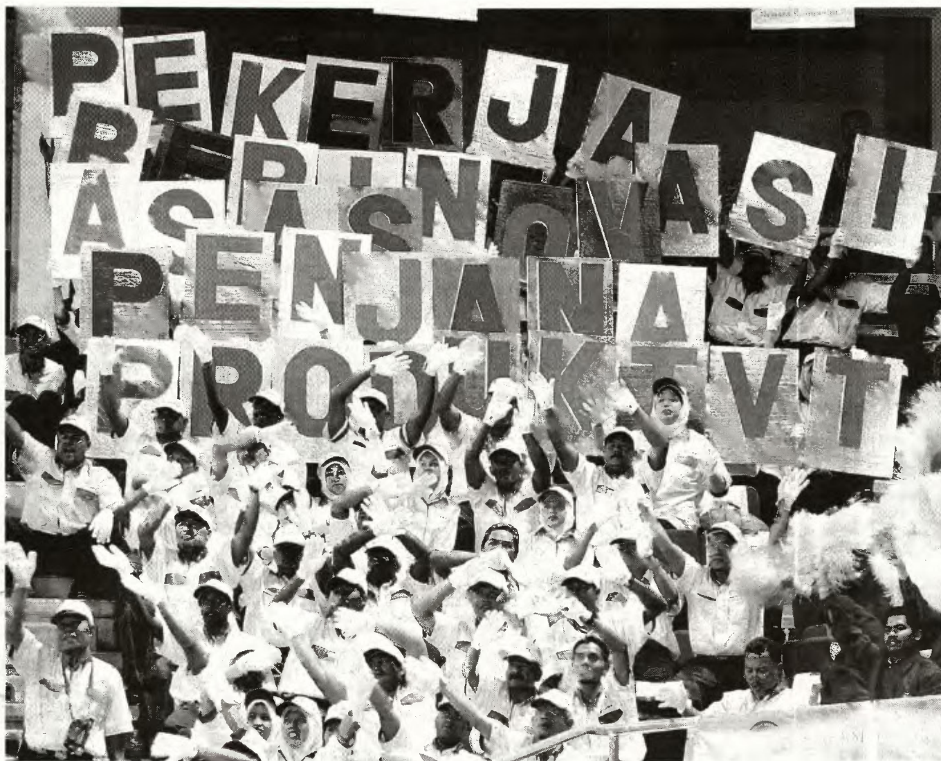
HARI Pekerja disambut sebagai hari untuk memperjuangkan kebajikan pekerja, hari ini ia dilihat sebagai sambutan yang dikongsi semua pihak, termasuk majikan serta kerajaan.

Sementara 43,474 pekerja terbabit dalam pemberhentian sementara (10,403 pekerja) dan pemotongan gaji (33,071) sebagai langkah majikan mengurangkan kos operasi dan pada masa sama me-