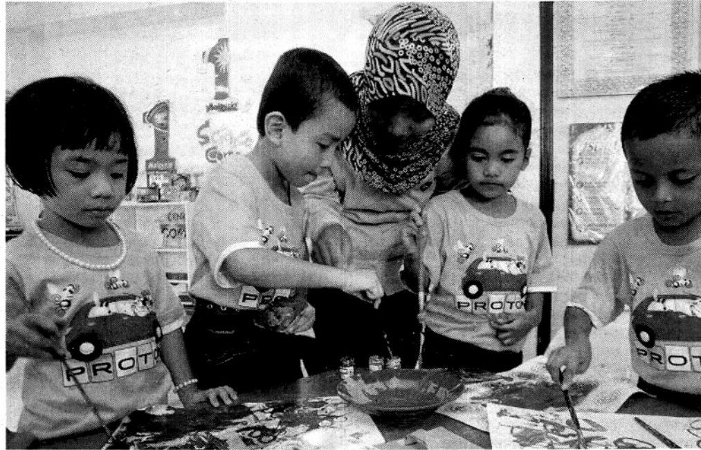
KEADAAN persekitaran Taska Proton di Shah Alam.

Apa yang penting, katanya, penubuhan PAKK ini dapat mengurangkan kebergantuan