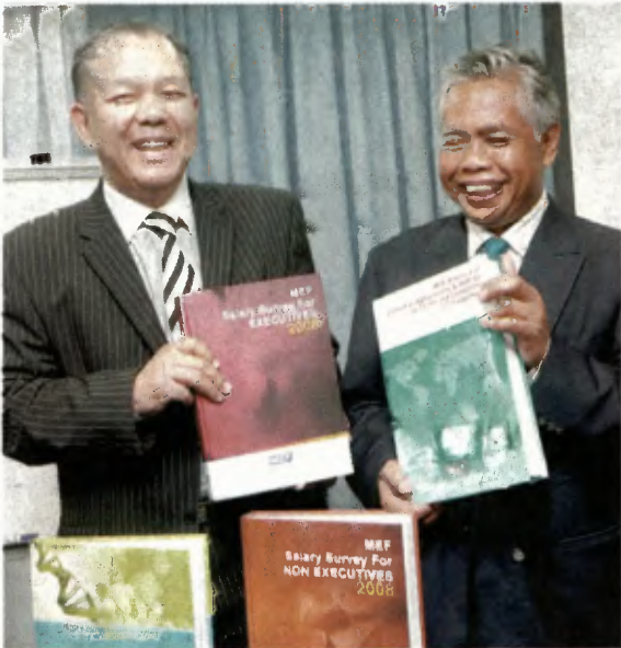
● 公司。丁。2008年员工薪资调查发现，202家企业机构中只有一家